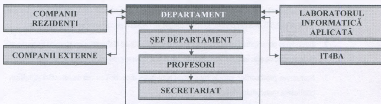
Figură 1 Structura organizatorică a departamentului InfAB

Structura organizatorică a Departamentului InfAB este prezentată în figura 1.